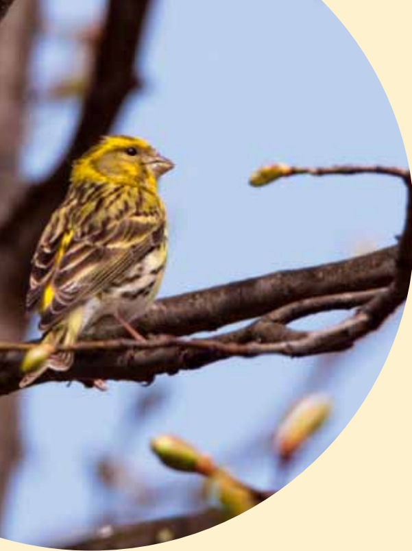
Europese Kanarie in Lottum bij Venlo, een van de weinige overgebleven min of meer vaste broedplaatsen.